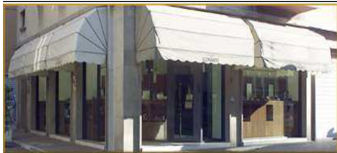
VIA PIAVE, 119